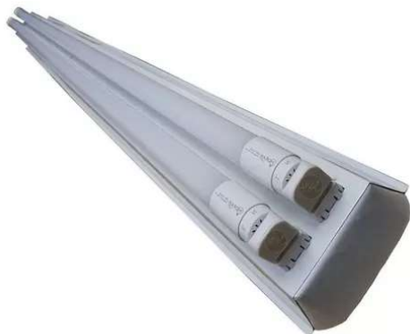
Modelo de referência para luminária.