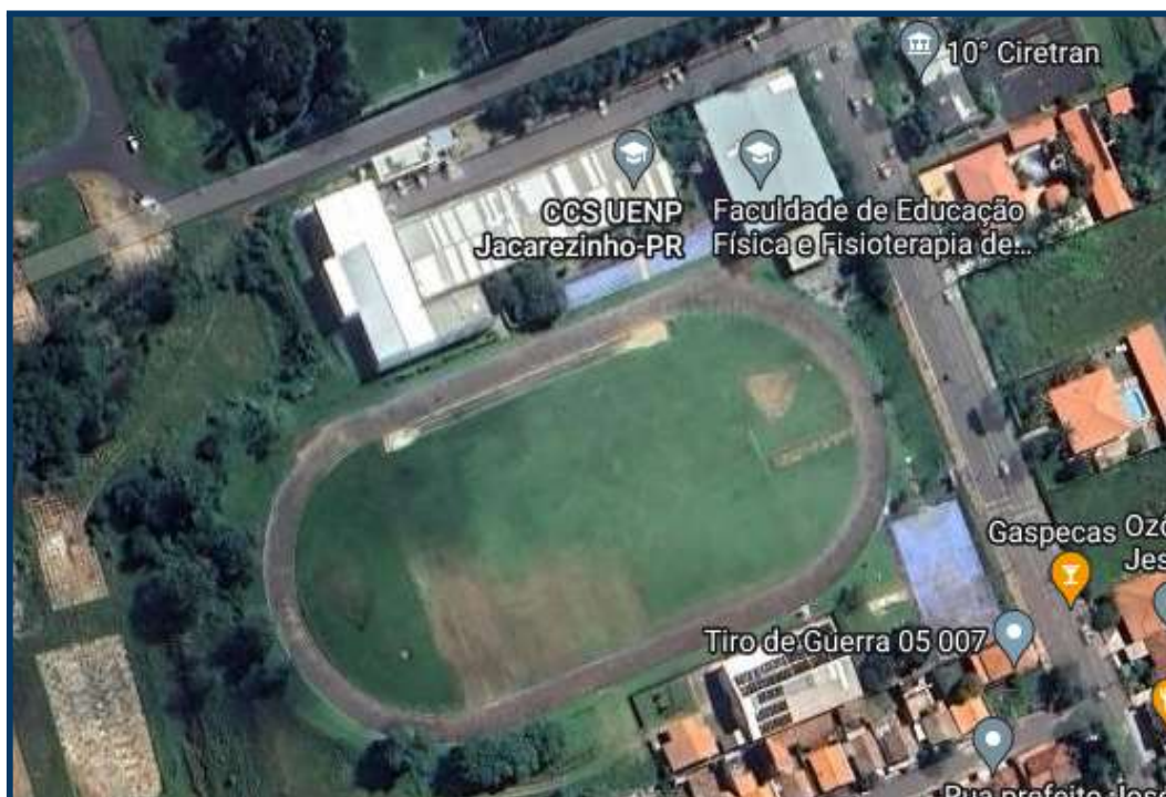
Figura 1: Centro de Ciências da Saúde/ CJ.

Todos os detalhes construtivos do presente serviço de construção deverão ser observados nos projetos e detalhamentos específicos que compõem o edital de licitação.