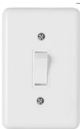
Modelo de referência de interruptor de embutir

Interruptores: Instalar interruptores de seccionamento das luminárias nos ambientes. Nas alvenarias novas deve ser do tipo embutir em caixa PVC.